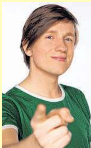
Moderator Johannes.

Deutschland besteht aus 16 Bundesländern. Jedes Land hat ein eigenes Parlament und eine eigene Regierung. Warum ist das eigentlich so? Und worüber dürfen Landesparlamente überhaupt entscheiden? Das will Moderator Johannes herausfinden und besucht die Klasse 5d des Gymnasiums Lohmar. Die Schüler beschäftigen sich gerade mit Schulpolitik.