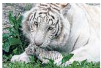
Tigrulya heißt das weiße Tiger-Weibchen in der Ukraine.

Drei Jungen und ein Mädchen hat ein weißes Tiger-Weibchen in einem Zoo in der Ukraine zur Welt gebracht. Eins der süßen Babys hat die seltene weiße Färbung der Mutter. Da die Mutter mit der Versorgung aller Kleinen überfordert ist, helfen Tierpfleger mit.