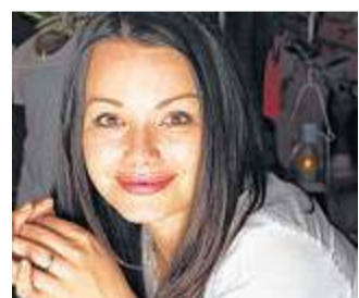
Cosma Shiva Hagen